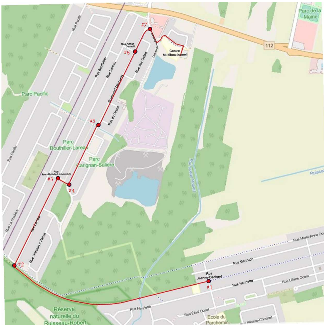
Camps de jour - Centre multifonctionnel